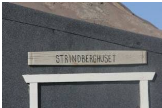
T.v. Gulvet i forrummet blev lavet af flade strandsten. T.h. Nyt navneskilt.