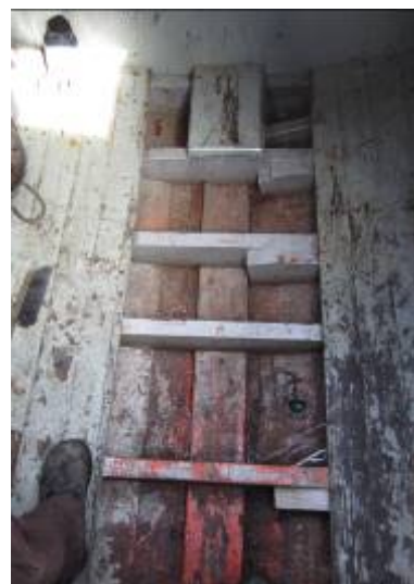
T.v. og midt. Midtskibs under isforhudningen. T.h. Køl, spanter og klædning er i god stand.