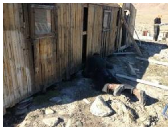
Strindberghuset bliver rettet op.