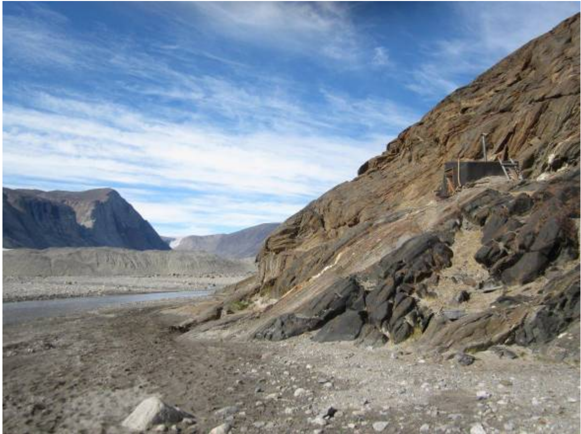
Fjordbottens fantastiske placering.