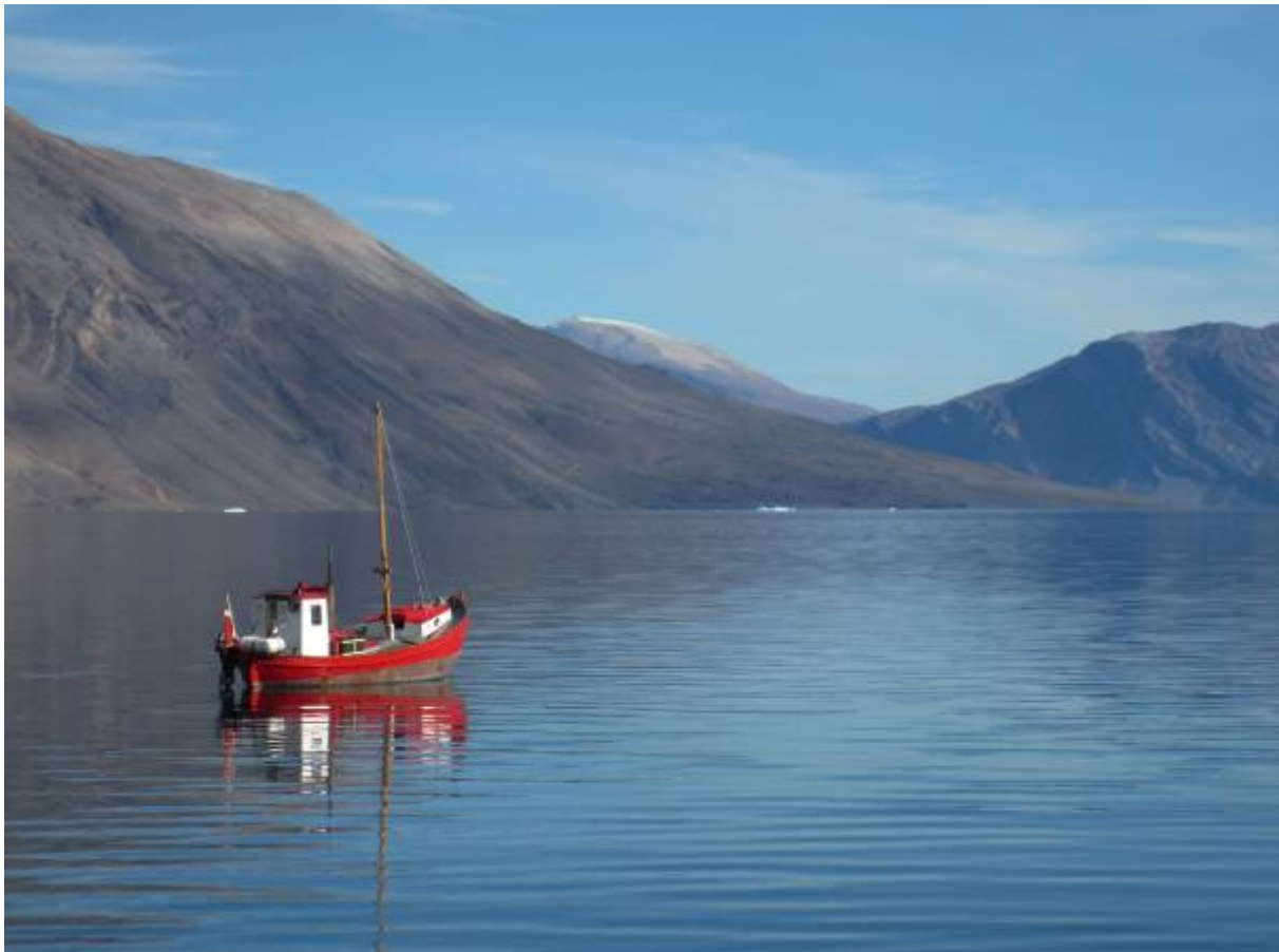
"Agsut" for svaj.