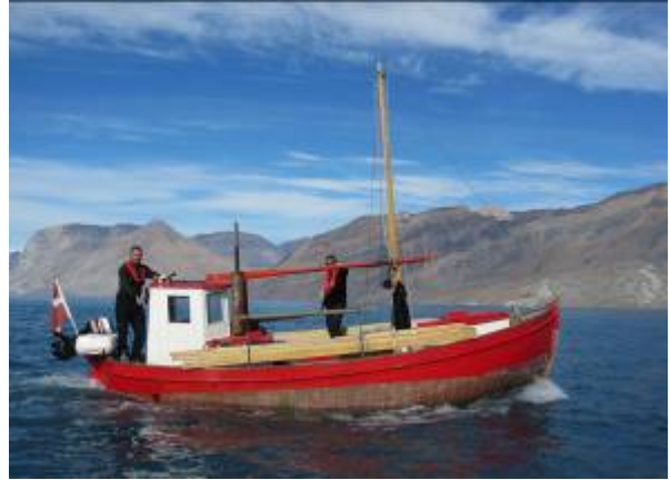
T.v. Utæthed ved på dæk. T.h. "Agsut" under sejlads.