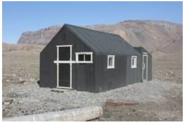
Strindberghuset klar at give ly og læ til nationalparkens gæster i mange år fremover.

Hytten var færdig og stod nu igen pæn og brugbar på den plads den blev bygget på for snart firs år siden. Klar til igen at give ly og læ til nationalparkens gæster i mange år fremover.