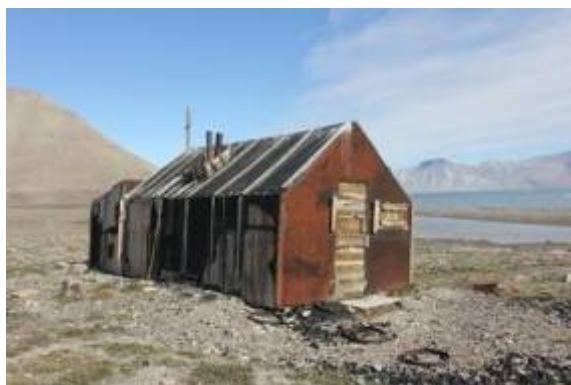
Strindberghuset ved ankomsten.