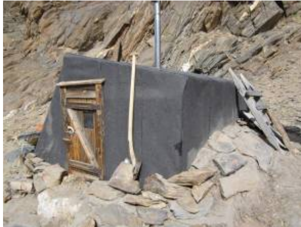
Fjordbotten før og efter renovering.