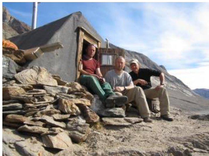
T.v. Fjordbotten indvendig med ny Nanok ovn. T.h. Hytten er klar.