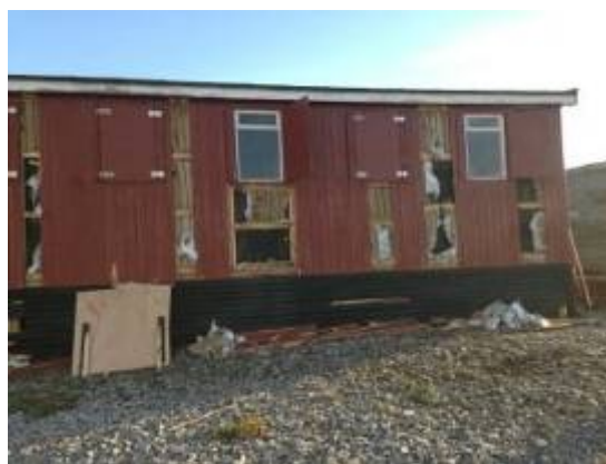
T.h. Tolvmandsbarakken på Ella Ø var blevet slemt beskadiget af isbjørne.