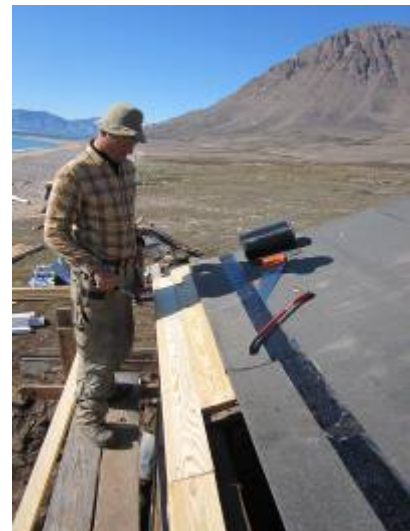
T.v. Oprydning i køkkenalrummet. T.h. Tagfoden repareres og klargøres med pap.