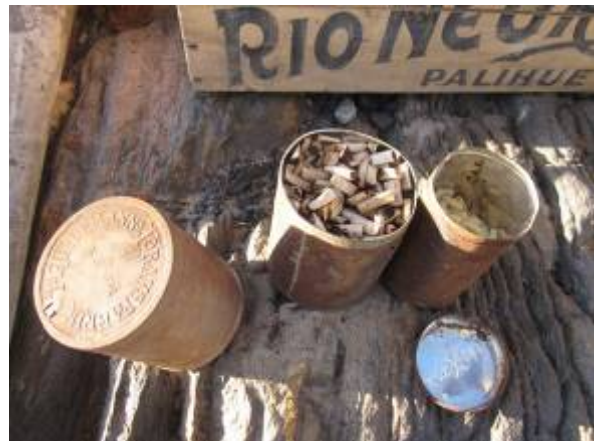
Fjordbotten indefra før renoveringen.

T.v. Alt er fyldt med sand. T.h. Gamle hjemmerullede cigaretskodder, stadig rygbare!