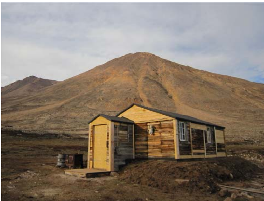
Nyt liv i Dødemandsbugten.

Dødemandsbugten er et af de mest spændende, historiske steder i Nordøstgrønland. Talrige inuit hustomter vidner om, at stedet har været en stor og vigtig boplads for svundne inuit-kulturer. Det var også her, at kaptajn Clavering ved et tilfælde i 1823 traf på de sidste få oprindelige nordøstgrønlandske inuit. Langt senere blev stedet en kort og hektisk periode under Anden Verdenskrig hovedkvarter for Nordøstgrønlands Slædepatrulje; det er fra den tid huset stammer. Huset var efterhånden ved at forfalde helt; men Nanok har nu - efter anvisning fra Grønlands Nationalmuseum & Arkiv i Nuuk – taget fat på istandsættelse af huset. Læs mere om dette og meget andet i denne rapport.