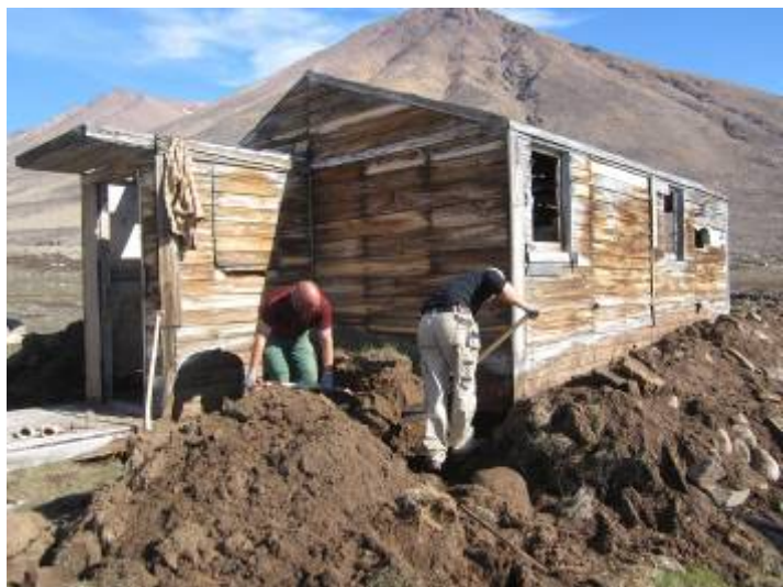
T.v. Gennemvædede træfiberplader. T.h. Huset graves fri for at kunne tørre.