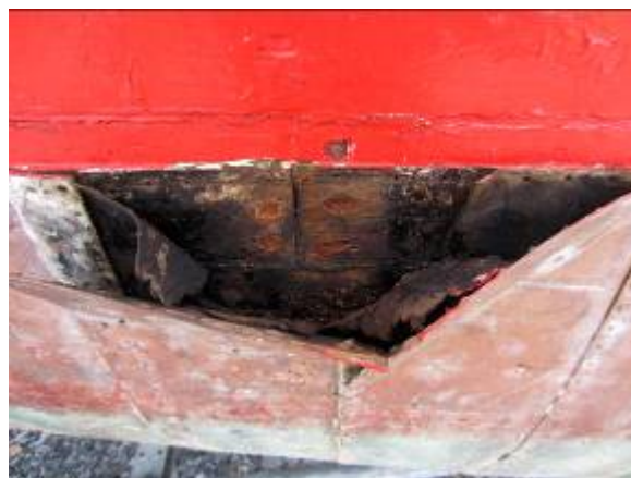
T.v. dækket set nedefra lastrum. T.h. planker under isforhudningen over vandlinjen.

holder stadigvæk fint. Den øverste del af skroget der ikke er isforhudet, var noget optørret og det var her den tog mest vand ind under sejlads. Dette kan afhjælpes ved at kalfatre nådderne på ny.