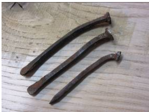
T.v. Søm tages ud for eftersyn. T.h. Søm – næsten som nye.