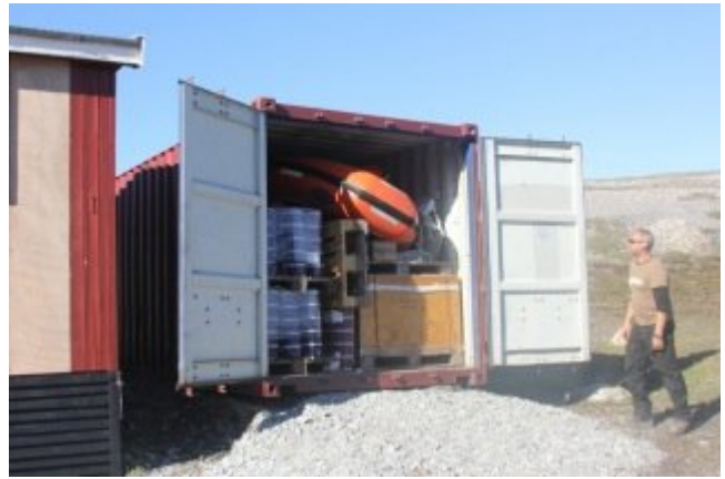
T.v. Der gøres klar til lagercontaineren. T.h. Containeren fyldt med gods ved ankomsten.

hjalp os endnu engang med at løfte de tunge ting ind på plads med deres nye supermaskine - teleskoplæsseren.