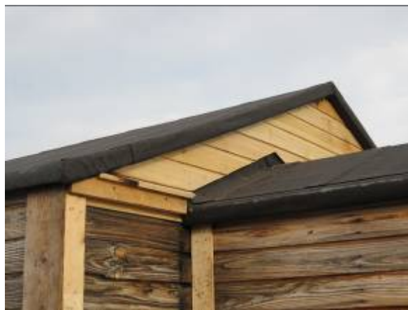
T.v. Taget får nyt pap. T.h. Færdigt gavlparti.

lag træfiberplader ud efterfulgt af metervis af gennemvædet og råddent træ. Nu kunne huset få luft og begynde at tørre.