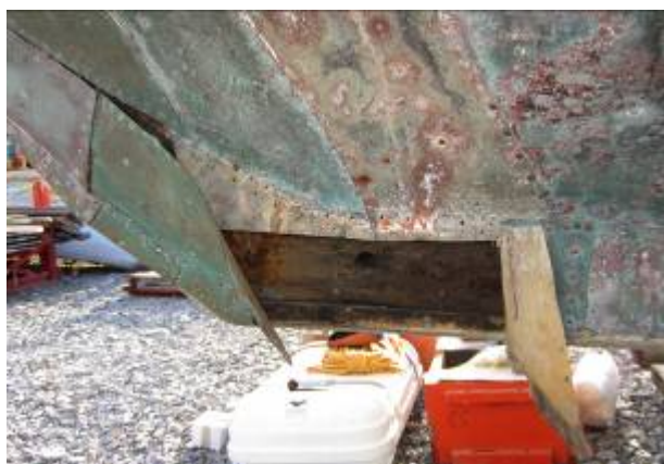
T.v. Agterstavn undersøges. T.v. Isforhudning løftet ved forstavn.