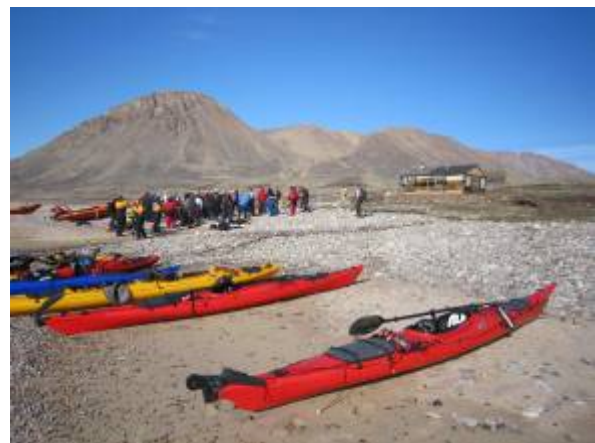
T.v. Krydstogtskib ankommer til Dødemandsbugten. T.h. 45 Australiske turister får rundtur og røverhistorier.