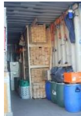
Nanok containeren på sin plads og fyldt med udrustning.